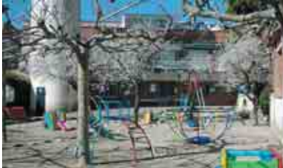
CA LA RITA