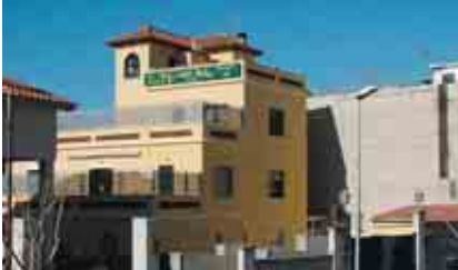
EL PETIT VAILET