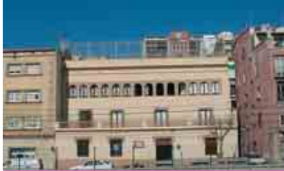
SAGRADA FAMÍLIA PRIVADA CONCERTADA

C/ M. Cinto Verdguer, 1 Telèfon: 93 555 04 07 - Fax: 93 555 12 28 col-safamasnou@xtec.cat www.xtec.cat/col-safamasnou Any d'inici de funcionament: 1914