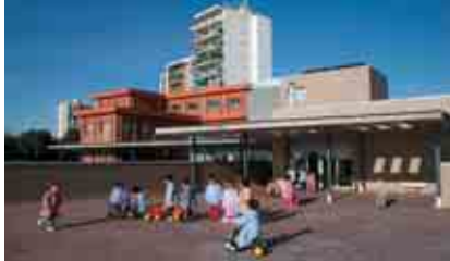
CEIP ROSA SENSAT

PORTES OBERTES: 6 de març, de 17.15 a 19 h