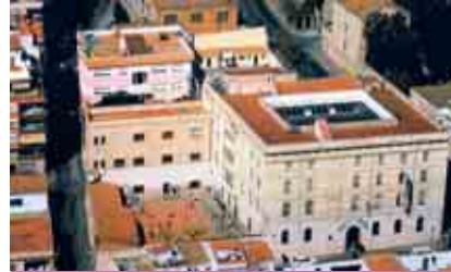
ESCOLÀPIES, LA IMMACULADA PRIVADA CONCERTADA

PORTES OBERTES: 22 de febrer, de 16 a 17.30 h