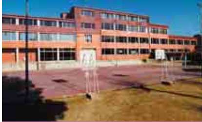
ESCOLA BERGANTÍ PRIVADA CONCERTADA

C/ Fra Juníper Serra, 46 Telèfon/Fax: 93 555 49 50 esc-berganti@xtec.net www.xtec.net/esc-berganti Any d'inici de funcionament: 1968