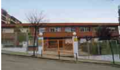
CEIP FERRER I GUÀRDIA