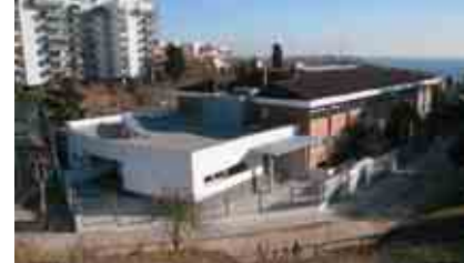
CEIP LLUÍS MILLET

VISITES PERSONALITZADES A L'ESCOLA EN EL MOMENT DE LA MATRICULACIÓ. S'HA DE DEMANAR HORA A DIRECCIÓ. No es fa jornada de portes obertes.